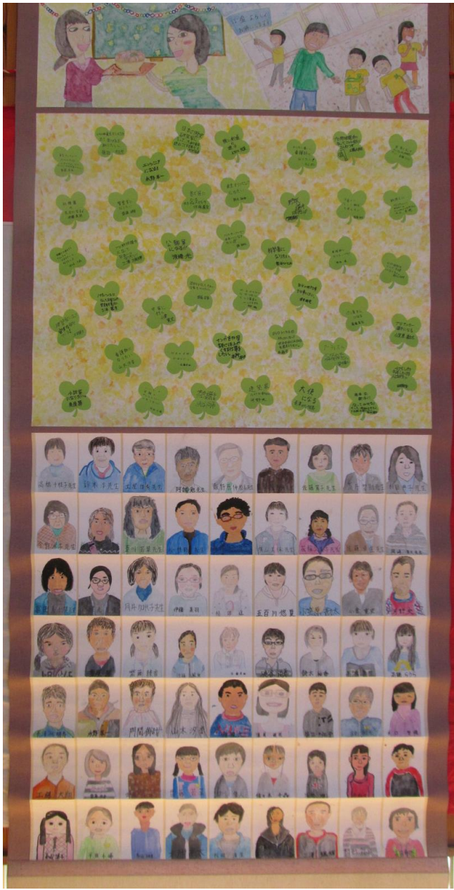
第 103 回卒 平成 26 年 3 月