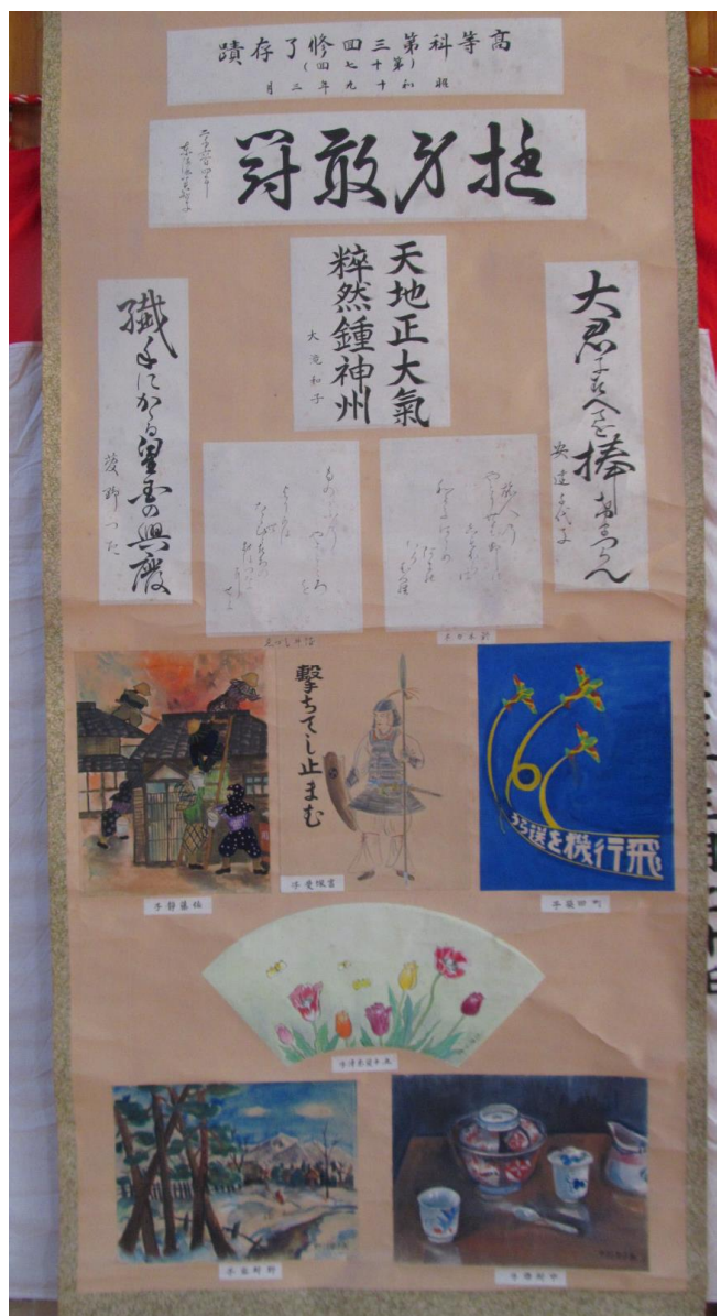
第 33 回卒 昭和 19 年 3 月