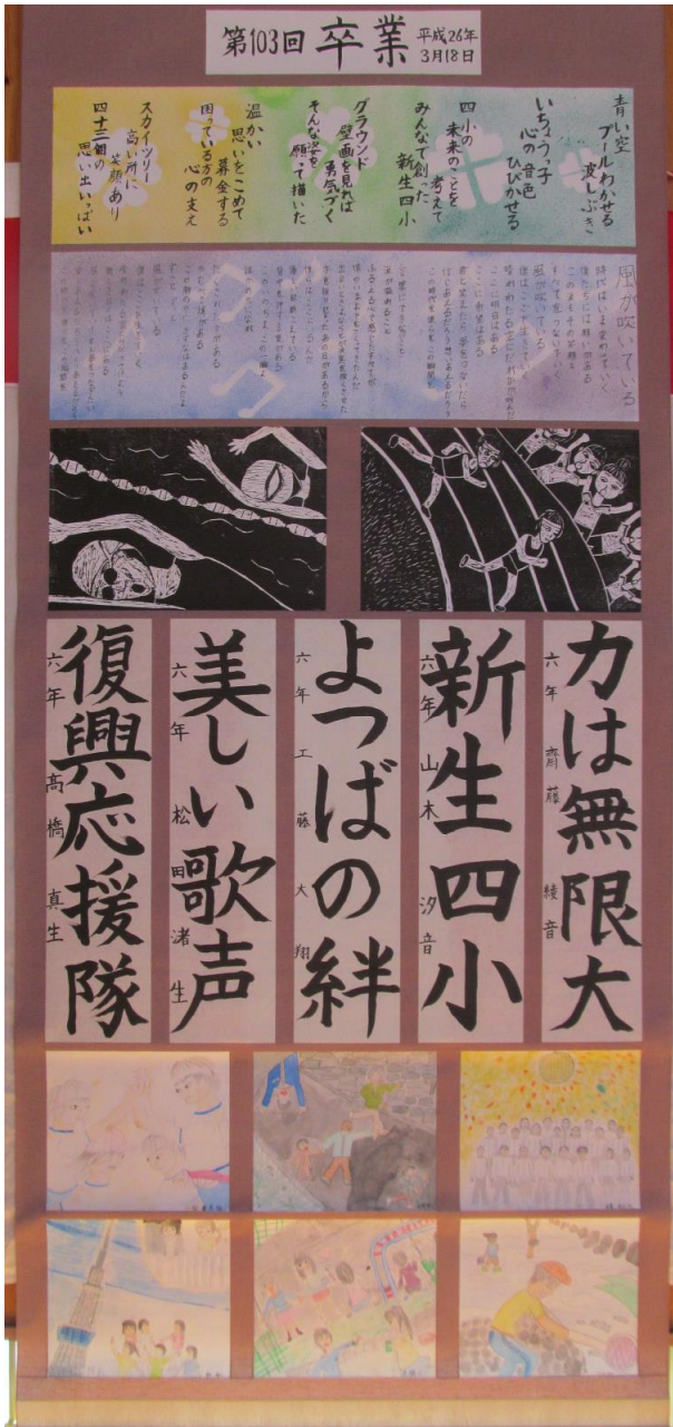
第 103 回卒 平成 26 年 3 月