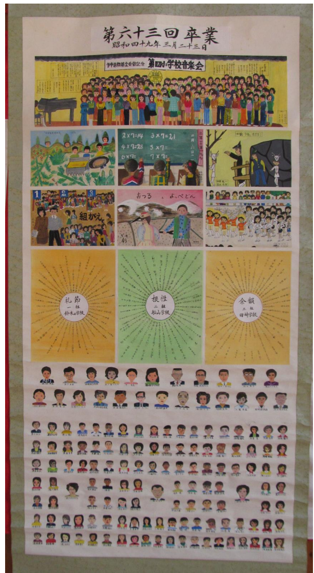
第 63 回卒 昭和 49 年 3 月