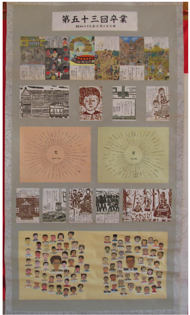
第 53 回卒 昭和 39 年 3 月