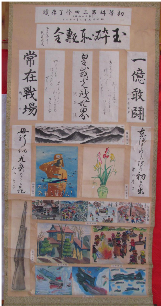
第 33 回卒 昭和 19 年 3 月