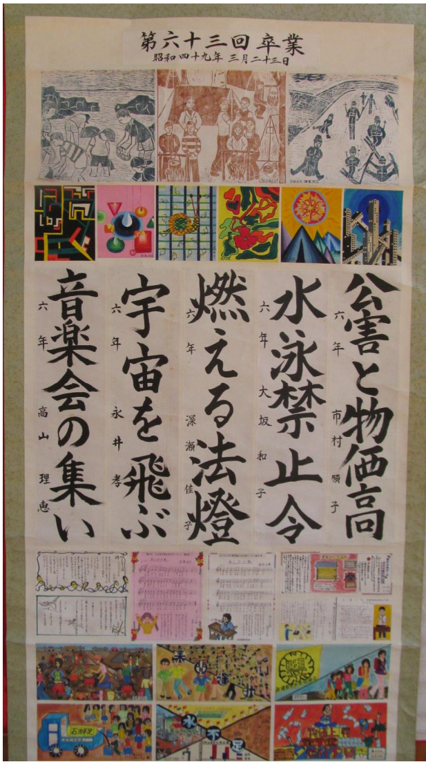
第 63 回卒 昭和 49 年 3 月