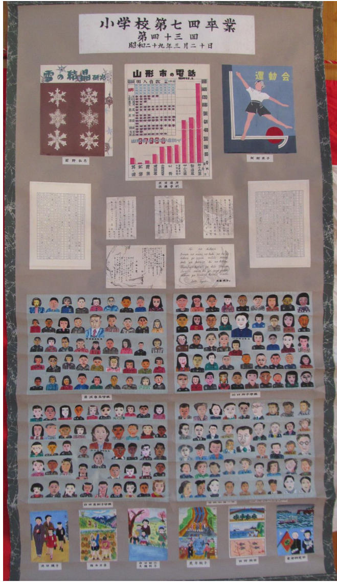
第 43 回卒 昭和 29 年 3 月