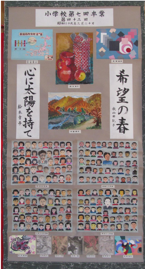
第 43 回卒 昭和 29 年 3 月