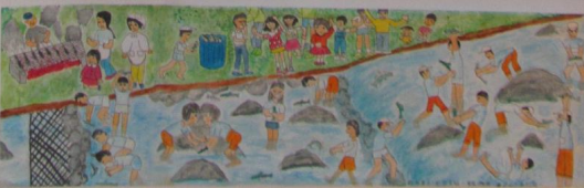
第73回卒業 昭和59年3月