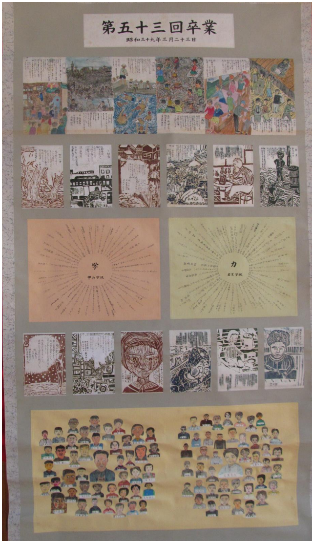
第 53 回卒 昭和 39 年 3 月