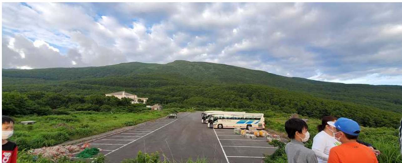
＜鳥海山 大平山荘パーキング到着＞