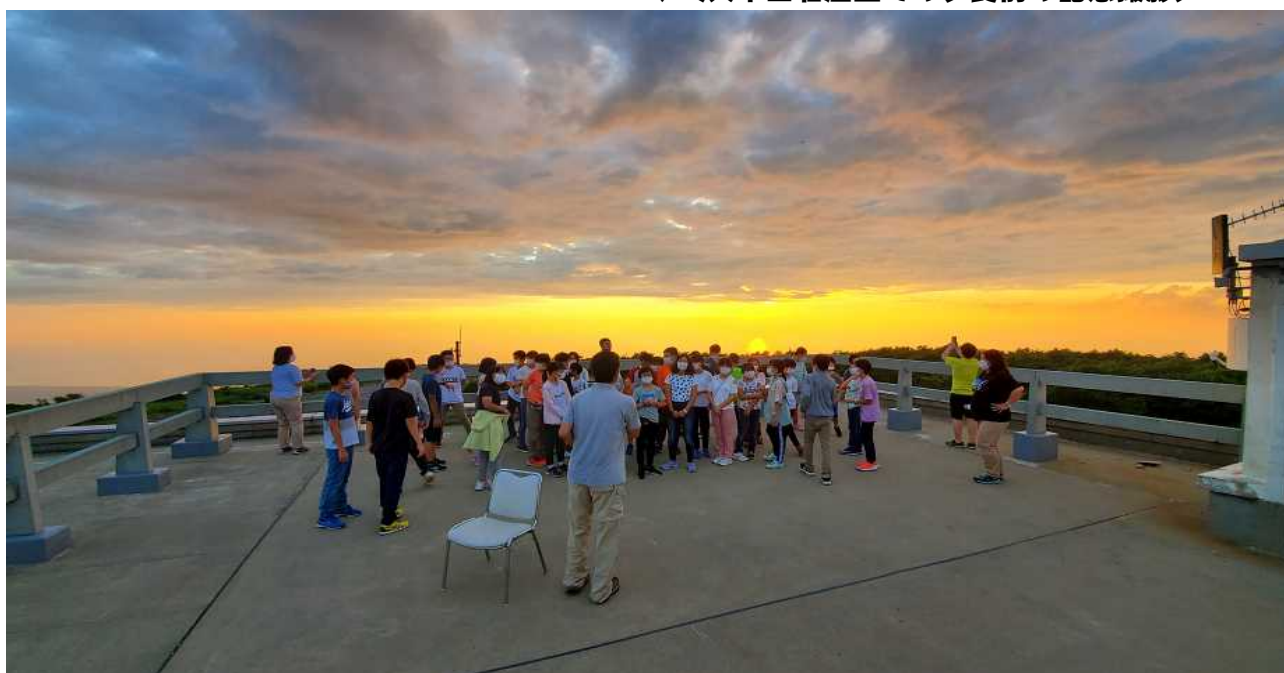
↓＜大平山荘屋上での夕食前の記念撮影＞