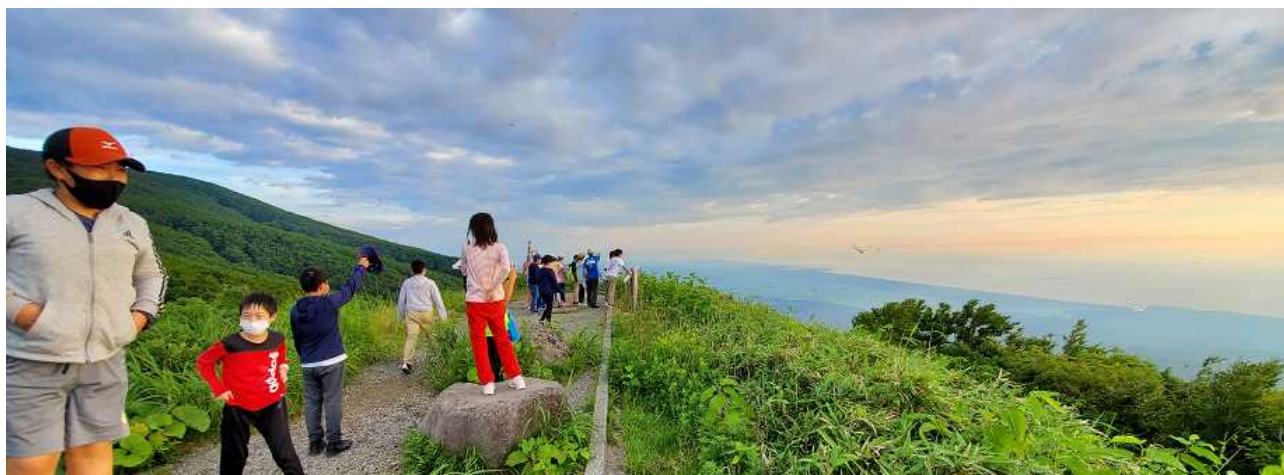
＜眺望パーキングから日本海を望む＞