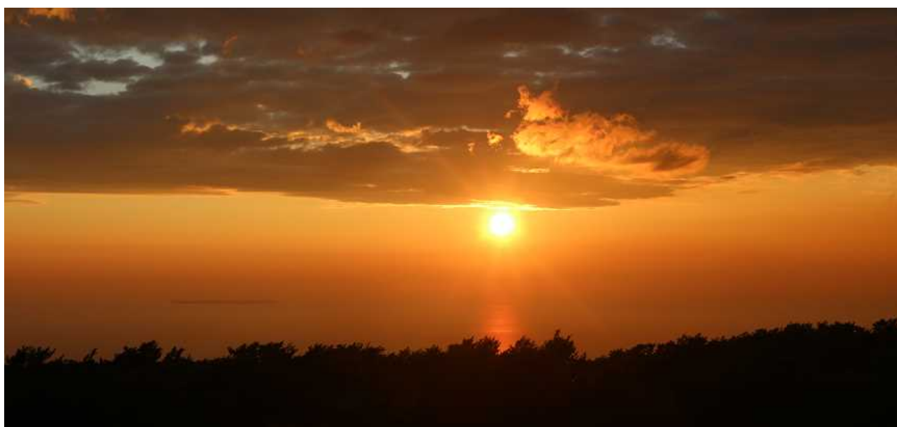
↑＜日本海に沈む夕陽 絶景！＞