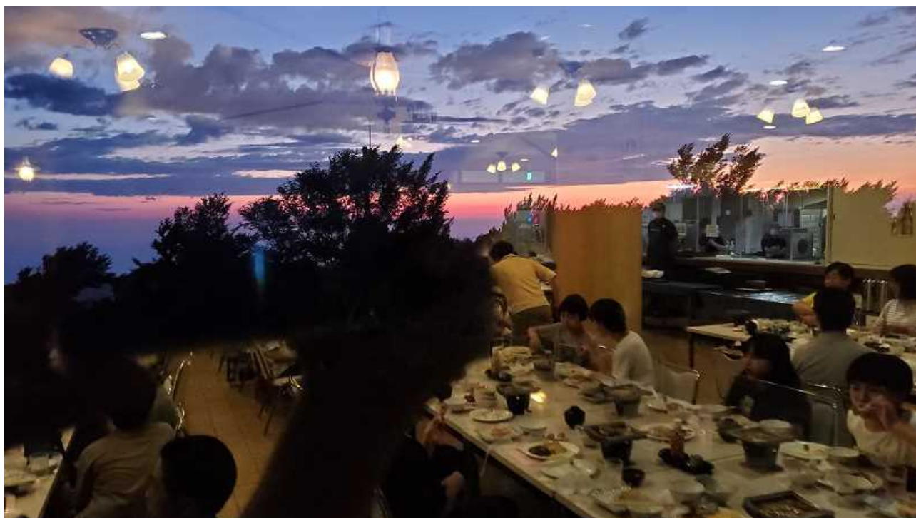
＜芸術的？な写真を1枚・・・夕食時にガラス越しに夕焼けを撮りました！！＞