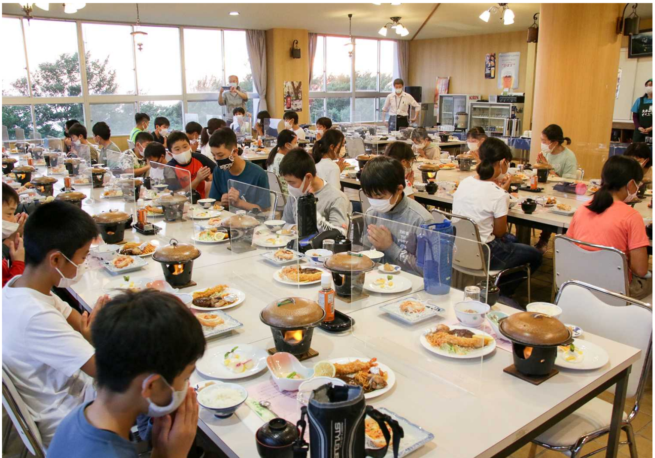
＜豪華夕食！ いただきまーす＞