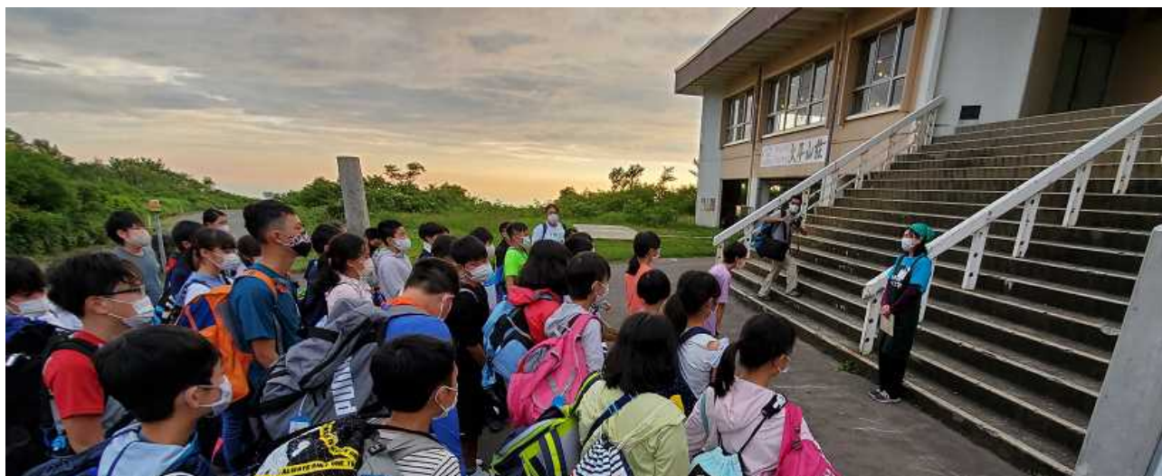
＜よろしくお願いします 大平山荘＞