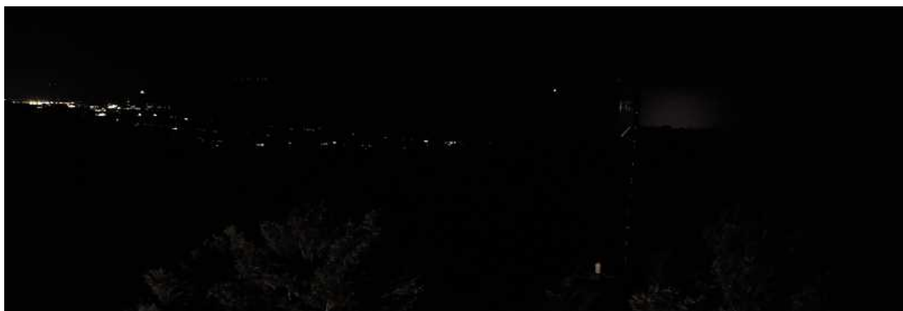
＜左は酒田市内の明かり！ 写真で満天の星空をご覧に入れられないのが残念です＞